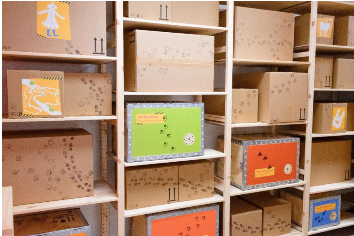
© Büro für Sinn und Unsinn