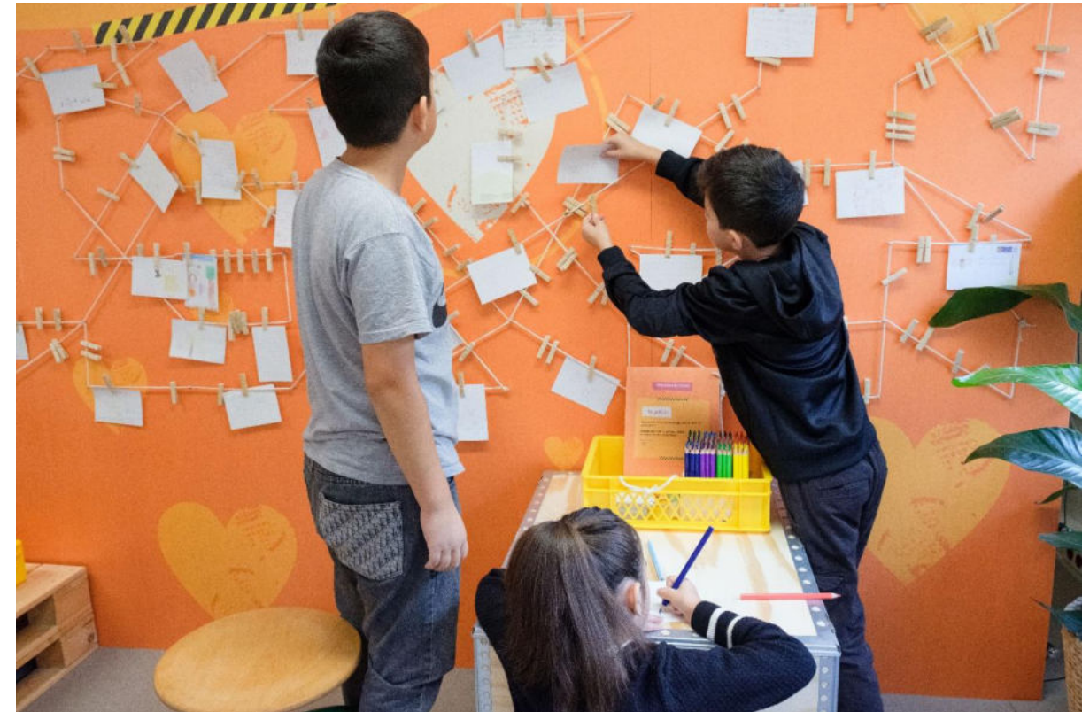
© Büro für Sinn und Unsinn