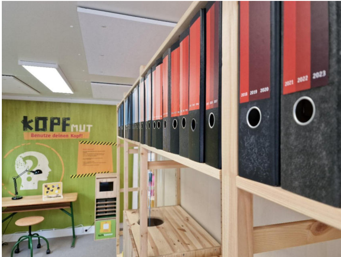
© Büro für Sinn und Unsinn