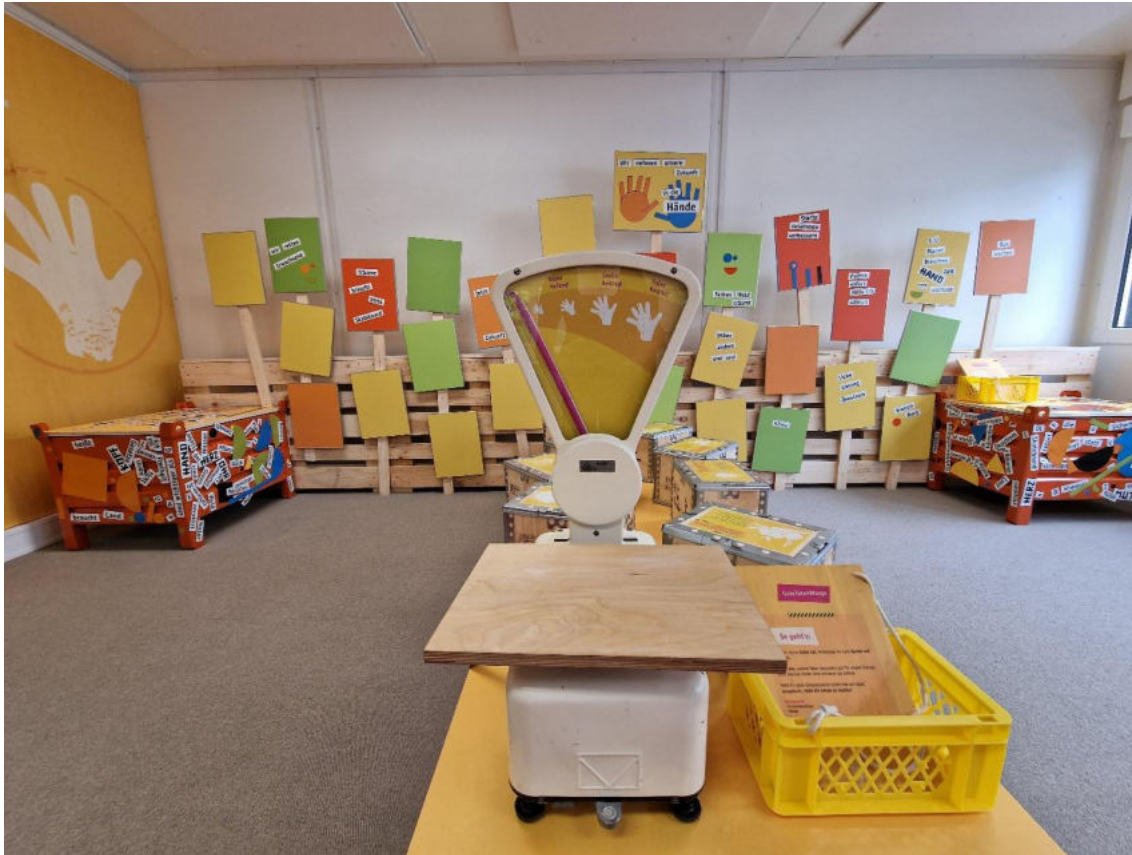
© Büro für Sinn und Unsinn