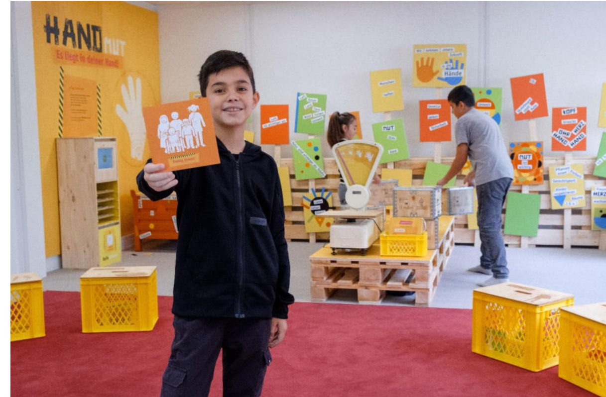
© Büro für Sinn und Unsinn