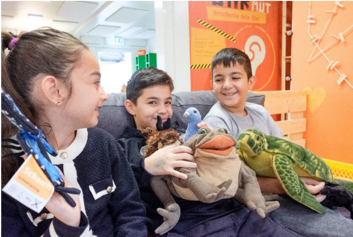
© Büro für Sinn und Unsinn