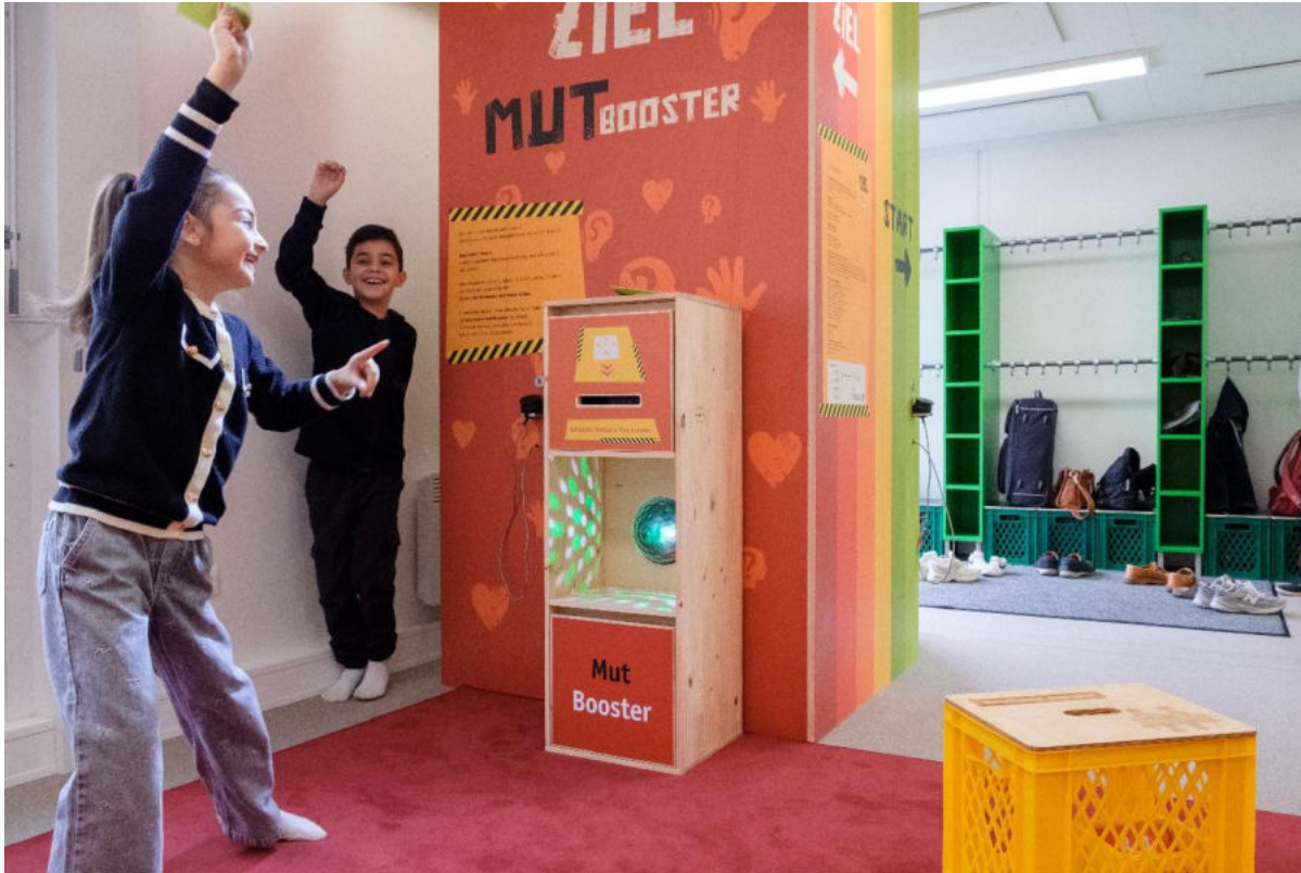
© Büro für Sinn und Unsinn