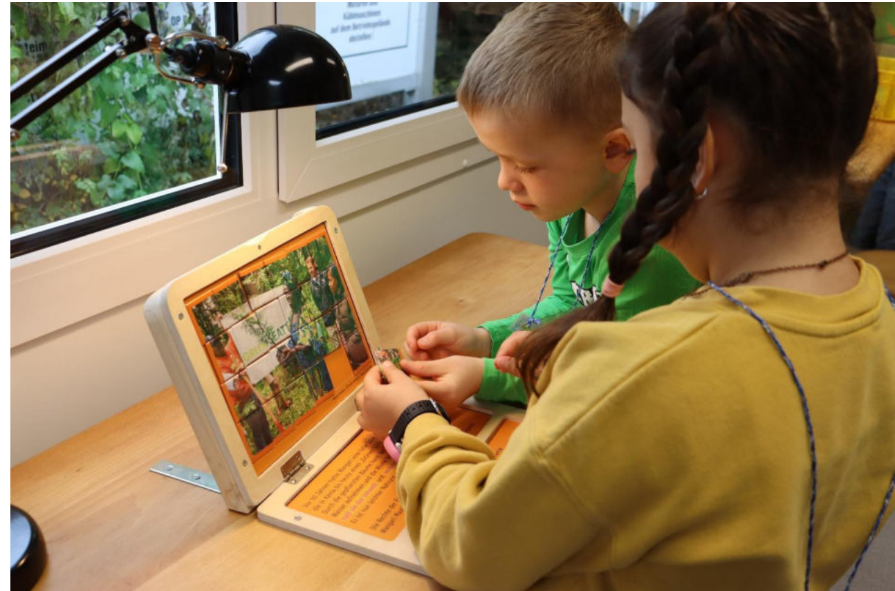
© Büro für Sinn und Unsinn