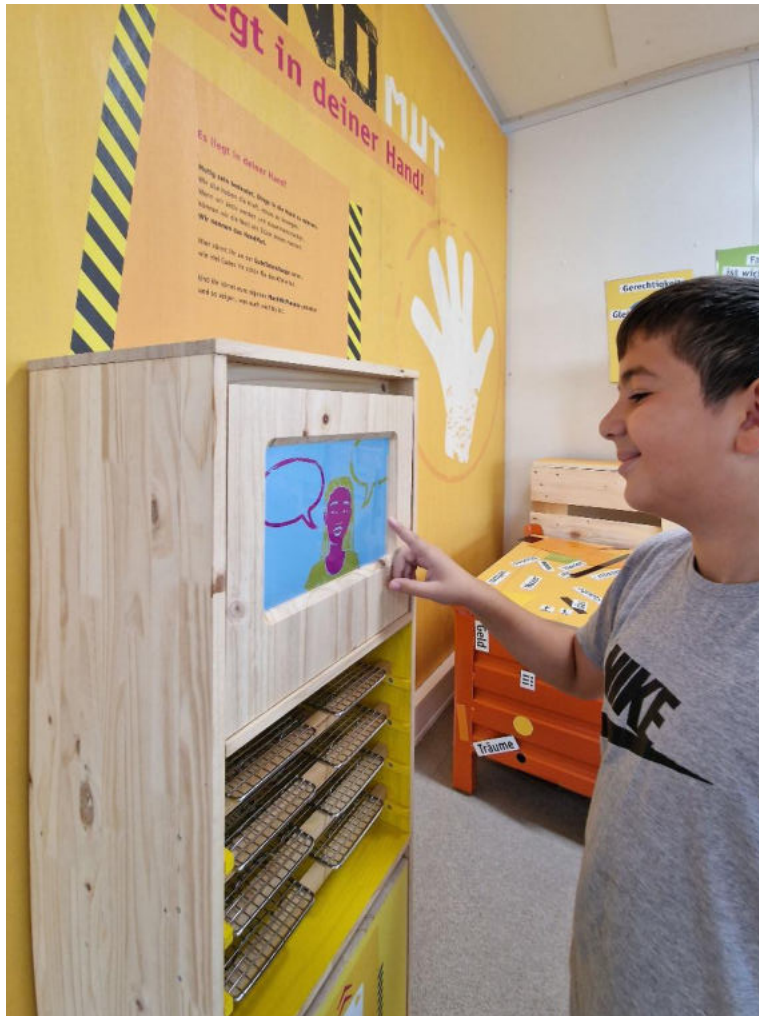
© Büro für Sinn und Unsinn