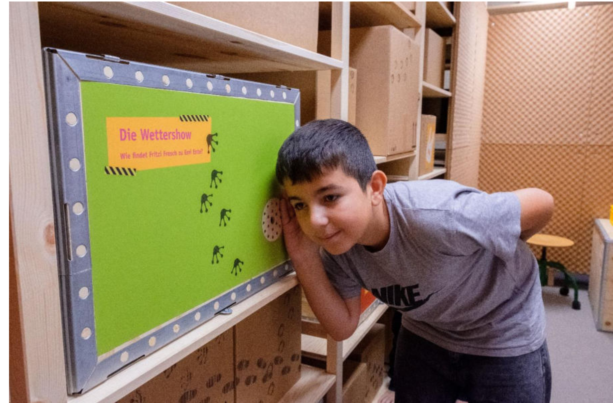
© Büro für Sinn und Unsinn