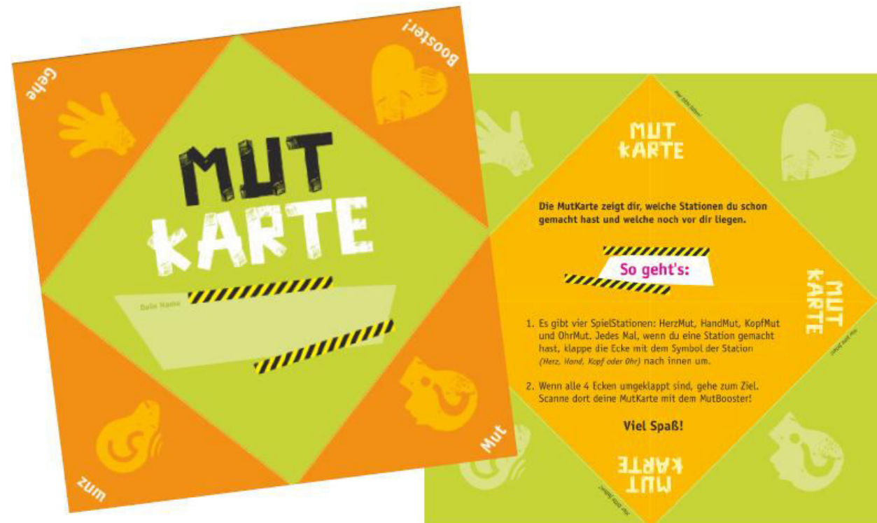
© Büro für Sinn und Unsinn