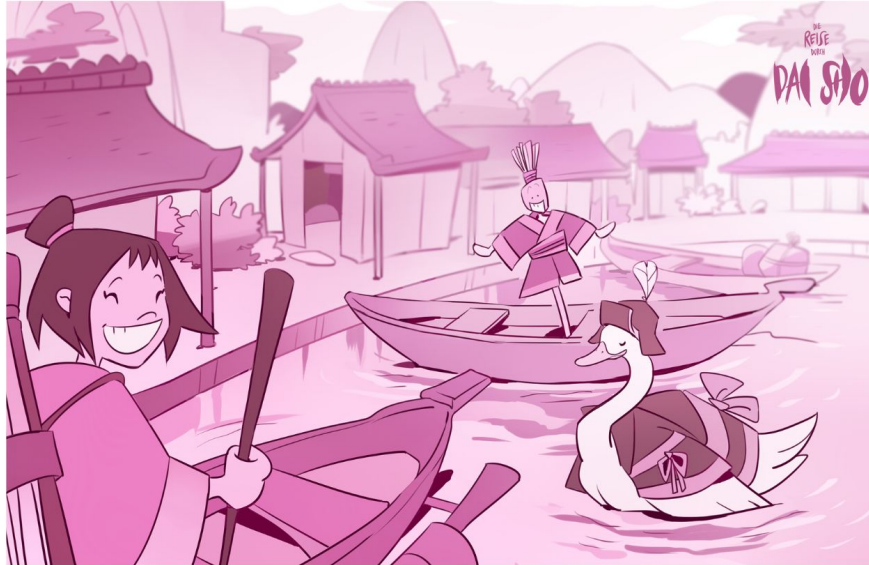
Reise durch Daisho