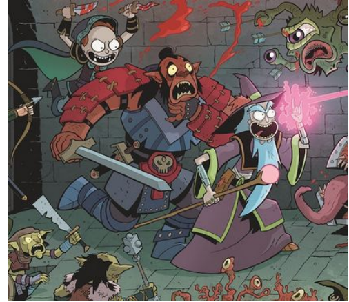
Rick & Morty